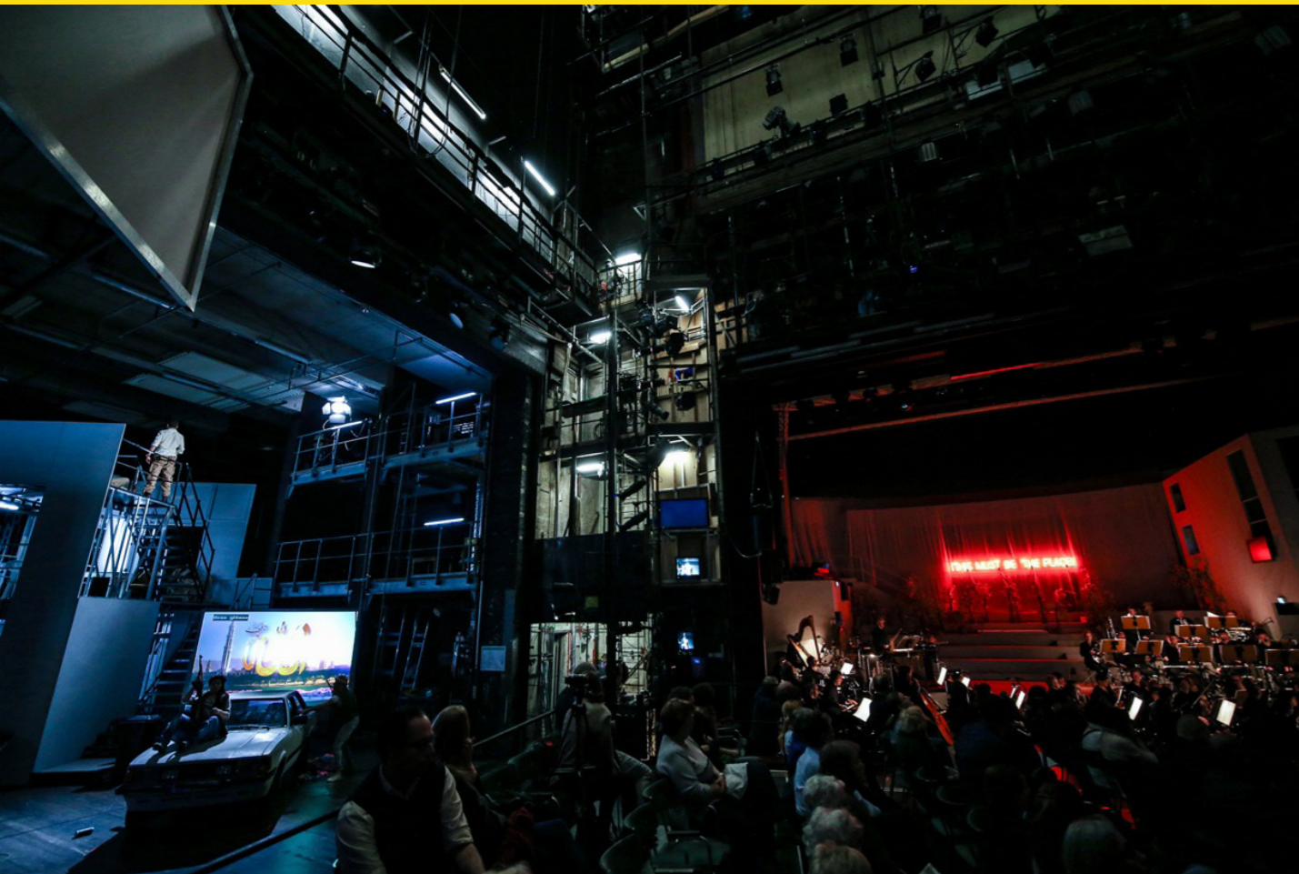
Sacrifice , Uraufführung von Sarah Nemtsov, Oper Halle, 2017

JK Sprichst du über Geld? Warum, warum nicht? Und falls ja: mit wem?