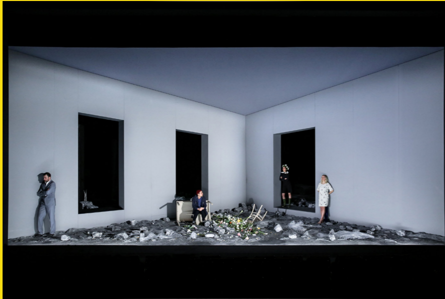
Frau vom Meer, Theater Bonn, 2017