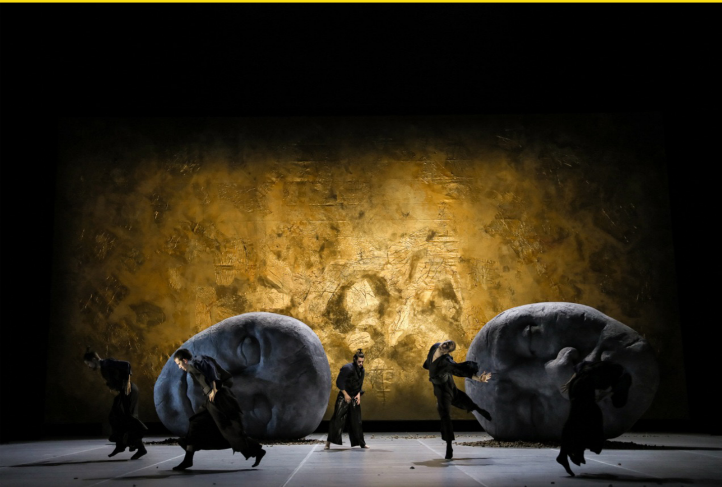
Shunkin, Staatstheater Saarbrücken, 2018

JK Kannst du etwas näher beschreiben, wie du zu deinen abstrakten Räumen findest? Was abstrahierst du? Wie funktioniert die Übersetzung konkreter Handlungsorte und oft sehr konkreter Zeitbezüge in so abstrakte Formen?