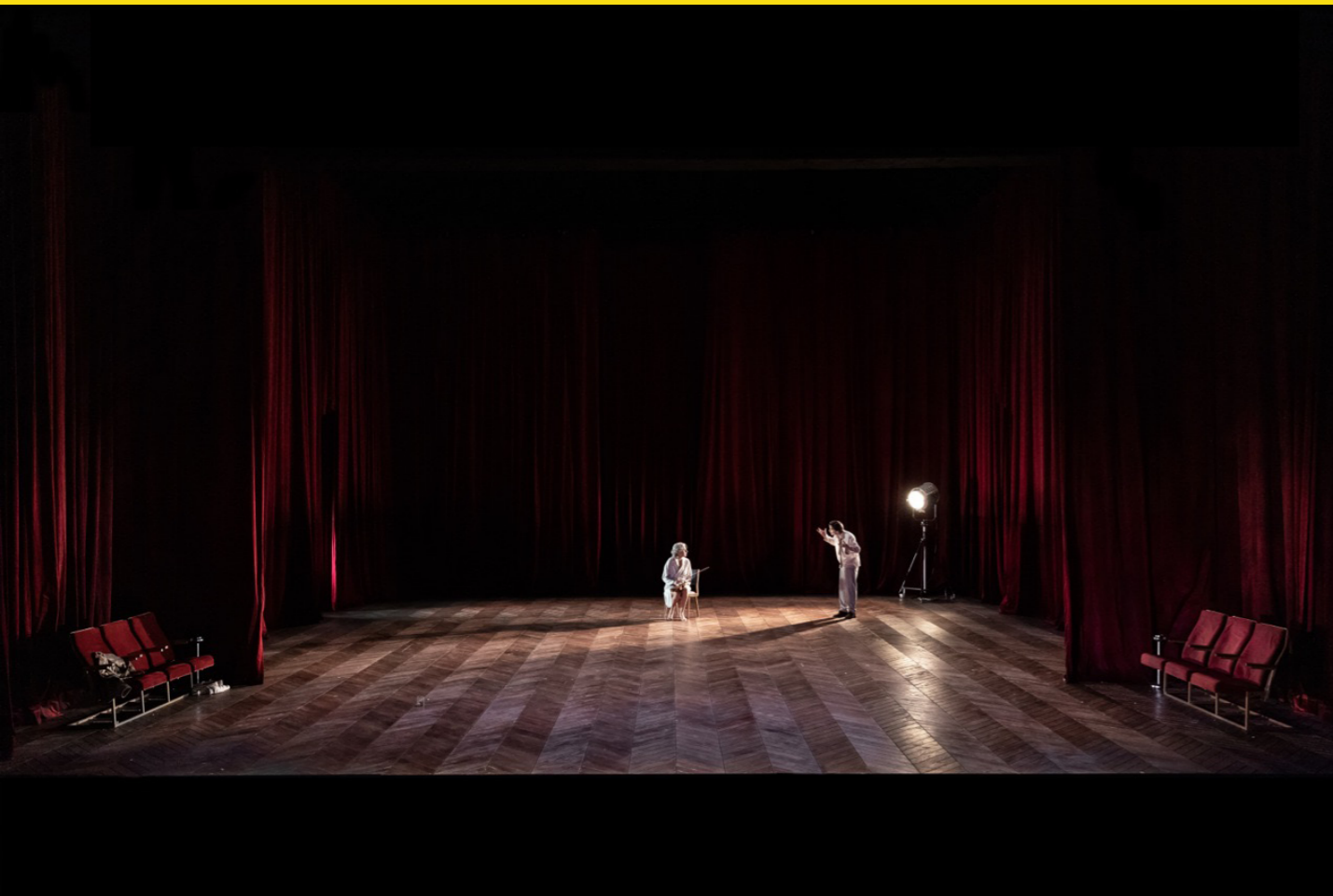
Langen Tages Reise in die Nacht, Theater Bonn, 2019

jetzt mindestens 3 Lösungen von 3 Häusern kenne.