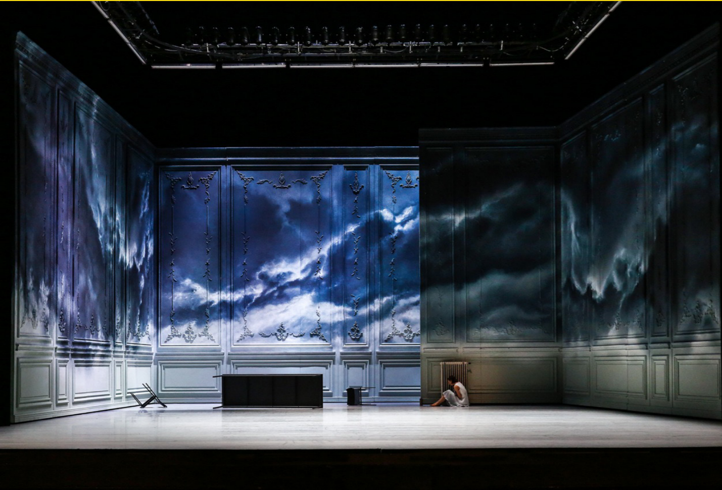
Aschenputtel, Hessisches Staatsballett, Staatstheater Wiesbaden/Staatstheater Darmstadt, 2015