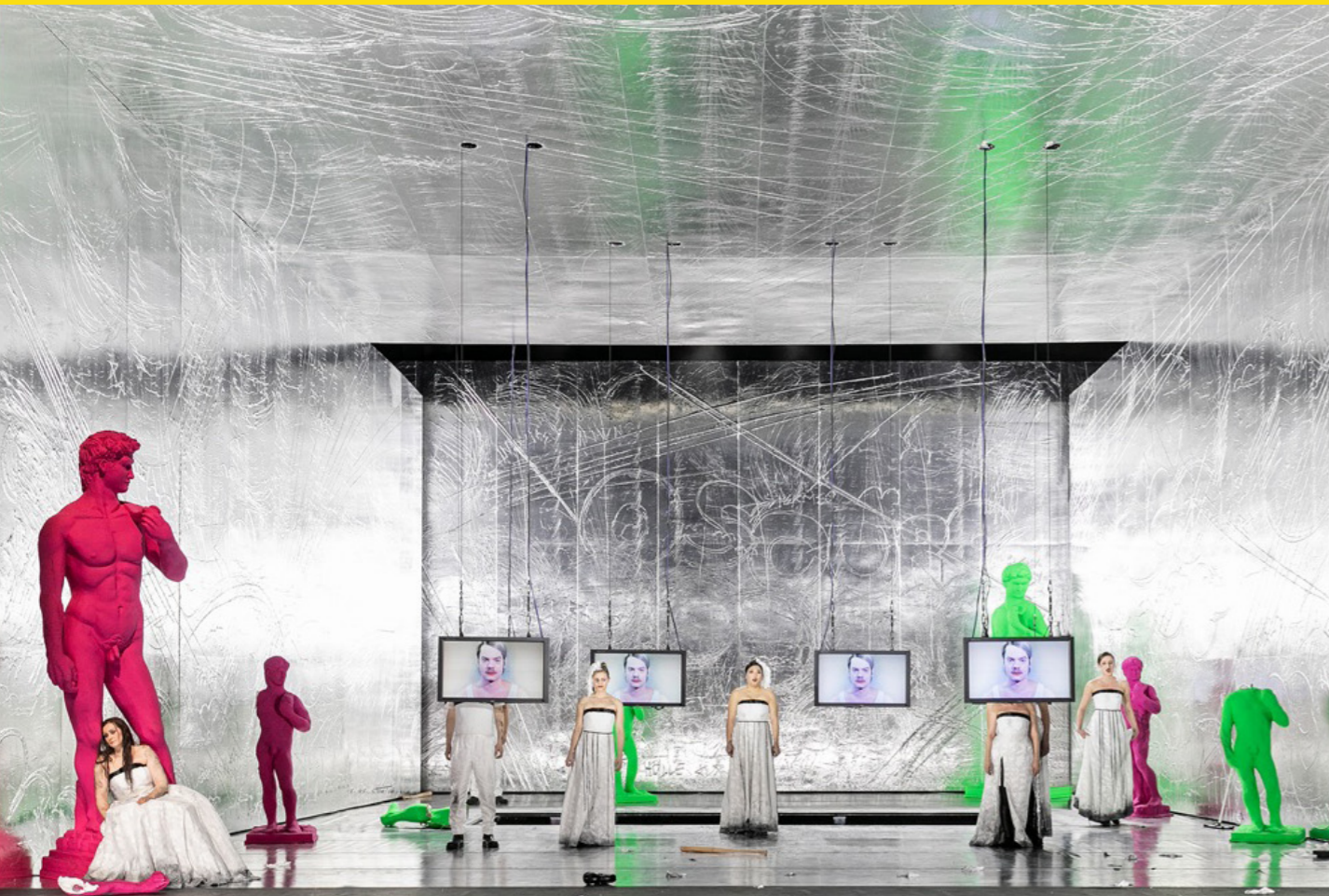
Ariadne auf Naxos, Oper Halle, 2019

SH Ein Werk wurde ursprünglich mit einer In-