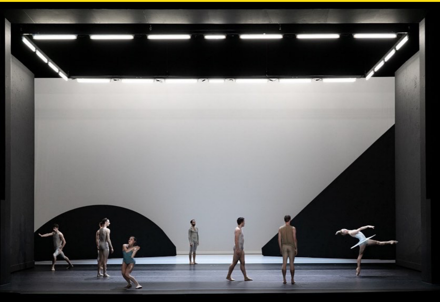
Prometheus, Staatstheater Saarbrücken, 2019