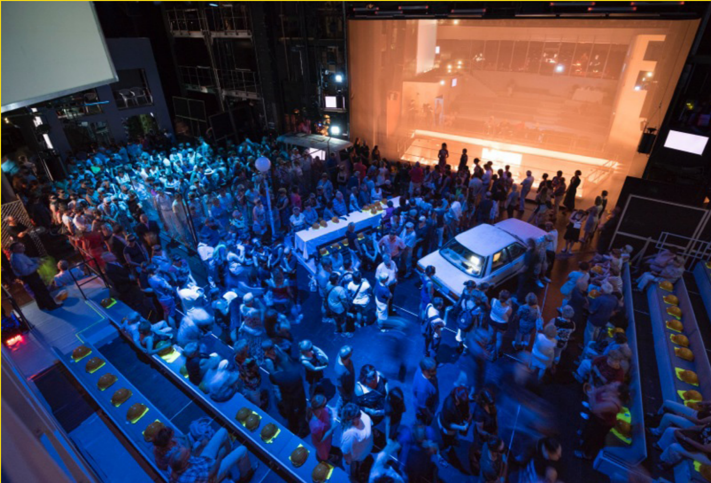
Der fliegende Holländer, Oper Halle, 2016