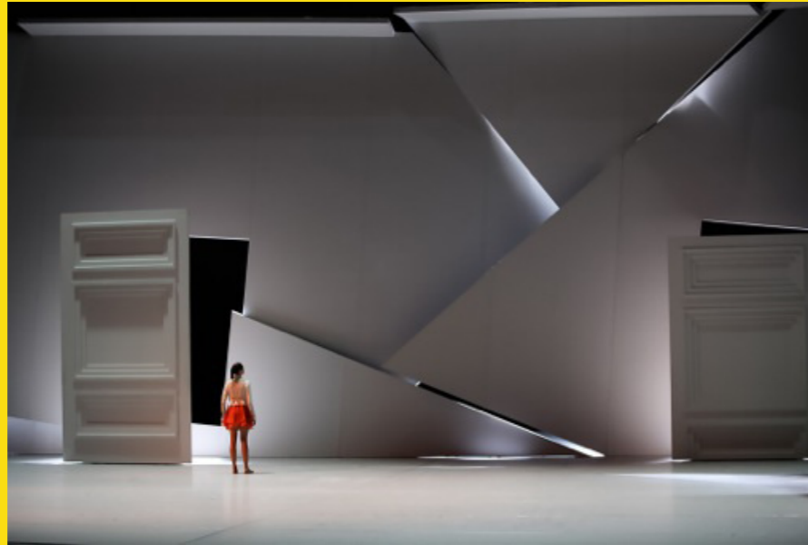
MOMO, Staatsballett Karlsruhe, Staatstheater Karlsruhe, 2012