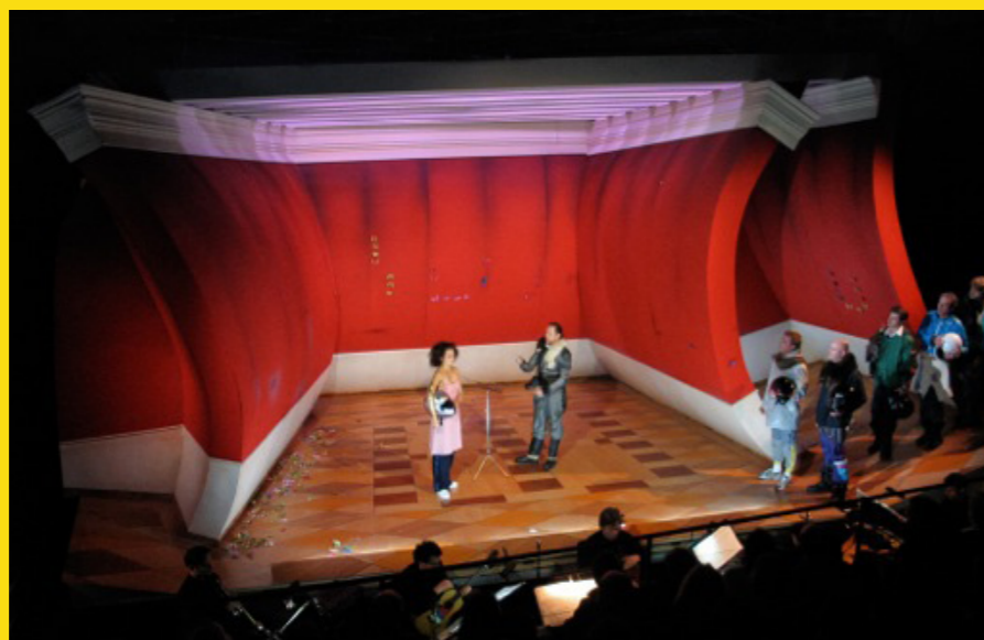
Fremd, Musiktheater von Hans Thomalla, Forum Neues Musiktheater der Staatsoper Stuttgart, 2006

meinen Partnern keine Raumideen. Ich schätze gegenseitige Achtung, Wertschätzung und Ehrlichkeit - bei vielen der Themen, die wir auf der Bühne erzählen, ist eine eigene und ehrliche Meinung gefragt.