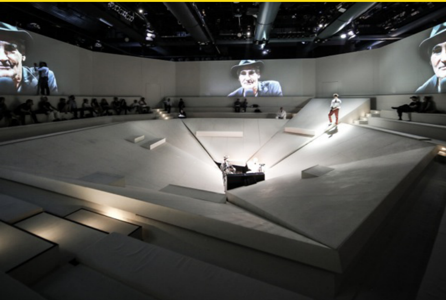
Glasperlenspiel, Staatstheater Karlsruhe, 2014

sozialen Medien oder im Internet gibt es ja die Möglichkeit, sich anhand von Bildern zu präsentieren, und diese Möglichkeit nehme ich wahr, ich glaube wenig daran, entdeckt zu werden. Deswegen dokumentiere ich meine Arbeit auch immer selbst, und dazu kann ich nur ermuntern!