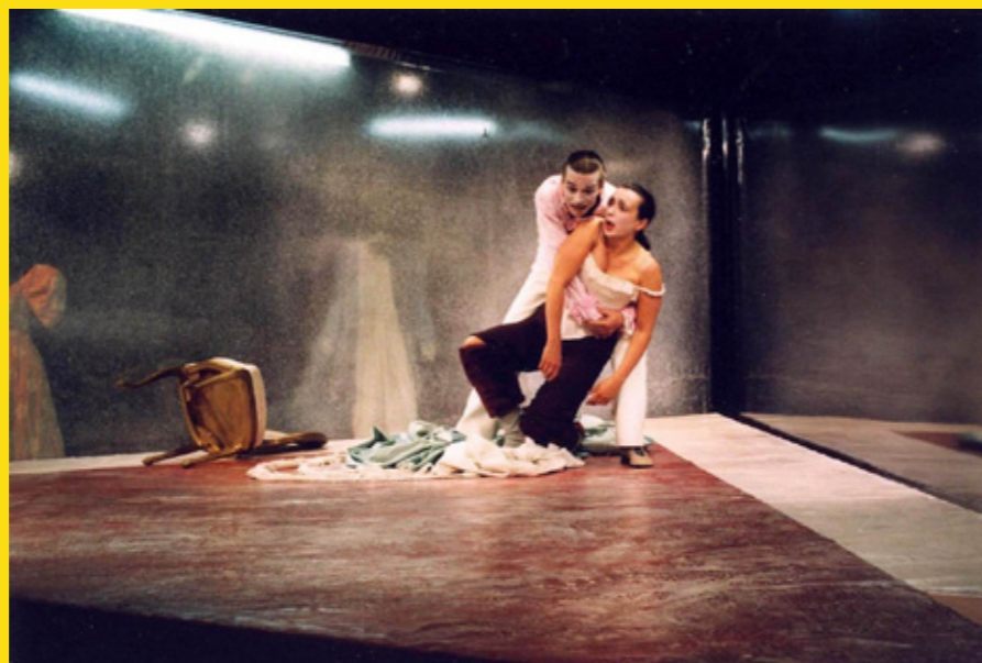
Quartett, Theater Münster, 2002

JK Wird die Ästhetik eines Theaterabends Deiner Meinung nach ausreichend in der Kritik berücksichtigt?