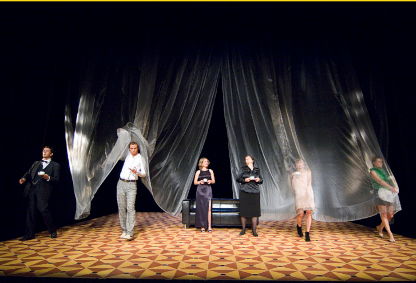
Tartuffe, Theater Neustrelitz, 2009

ER Dafür gibt es kein System. Allerdings bin ich jemand, der nach den ersten, an die Stoff-Einarbeitung anschließenden, Gesprächen