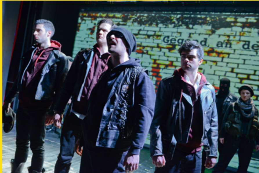
Die Räuber, Theater Eisleben, 2018