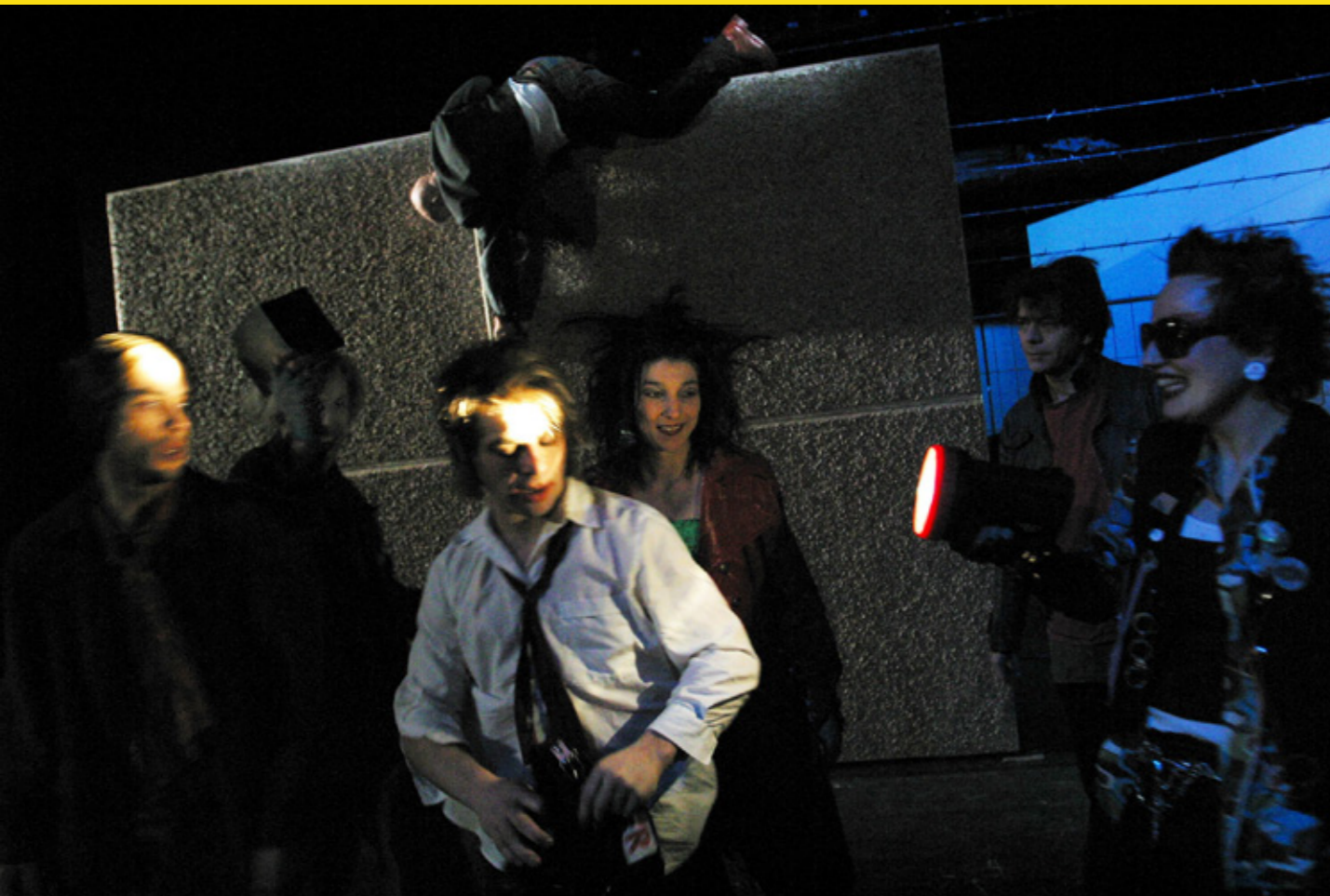
Helden für einen Tag, Schauspiel Düsseldorf, 2005