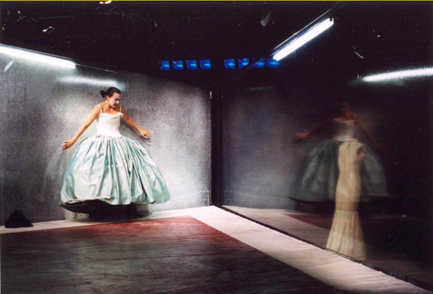
Quartett, Theater Münster, 2002