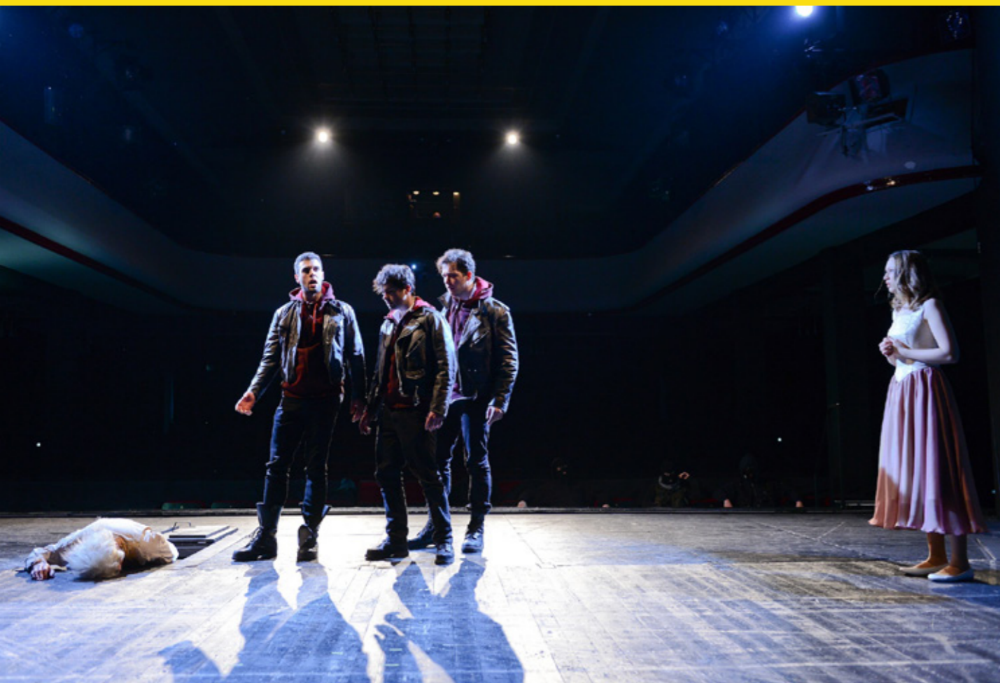
Die Räuber, Theater Eisleben, 2018

JK Was sagst du zur künstlerischen Gleichberechtigung im Team?