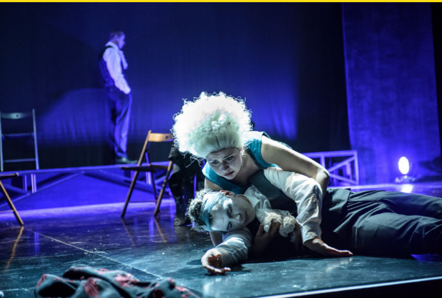
Amadeus, Theater Freiberg, 2019

wusstsein herzustellen. Das ist gut für den gemeinsamen Produktionsprozess, der damit aber nur seinen Start nimmt. Es sagt nichts über die mögliche Qualität der Ergebnisse aus.