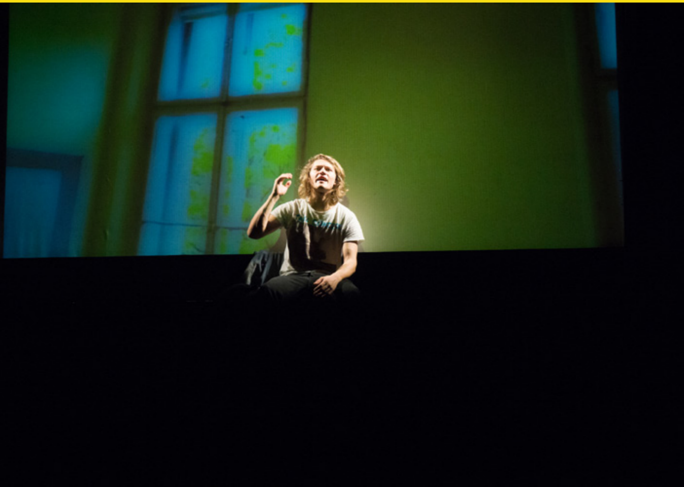
Die Durstigen, Theater Klagenfurt, 2015

gerne mit Text und/oder Musik und dem Modell oder Zeichenbuch allein ist. Das Selbstgespräch ist Voraussetzung für das nächste gemeinsame Gespräch.