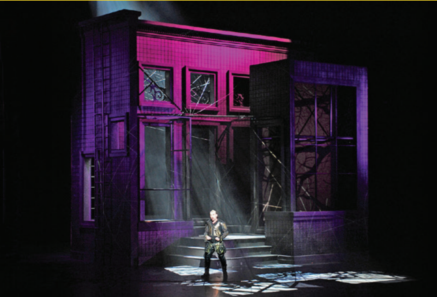
Otello, SNG Opera in Balet, Cankarjev Dom Ljubljana, 2016