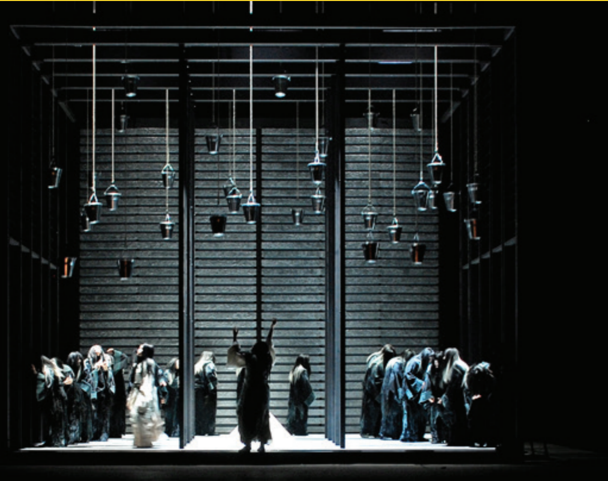
Matsukaze, Theater Kiel, 2015

Und ich muss schon sagen, dass mir dabei der Begriff der Werk-treue eher anachronistisch erscheint. Ein RICHARD III. kann doch auch faszinieren, wenn überhaupt kein Shakespeare