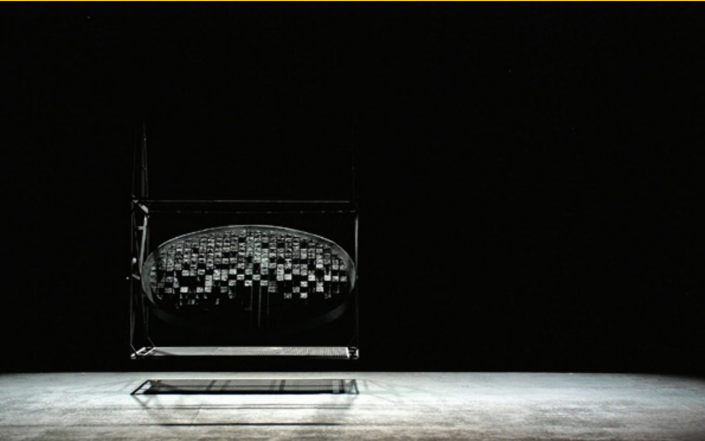
Carmen, Theater Kiel, 2015 / © Walter Schütze