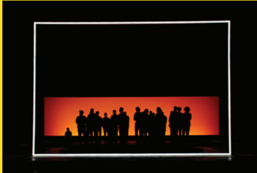
Fidelio, Teatro Bolzano, Teatro Dante Alighieri Ravenna 2011 / © Walter Schütze