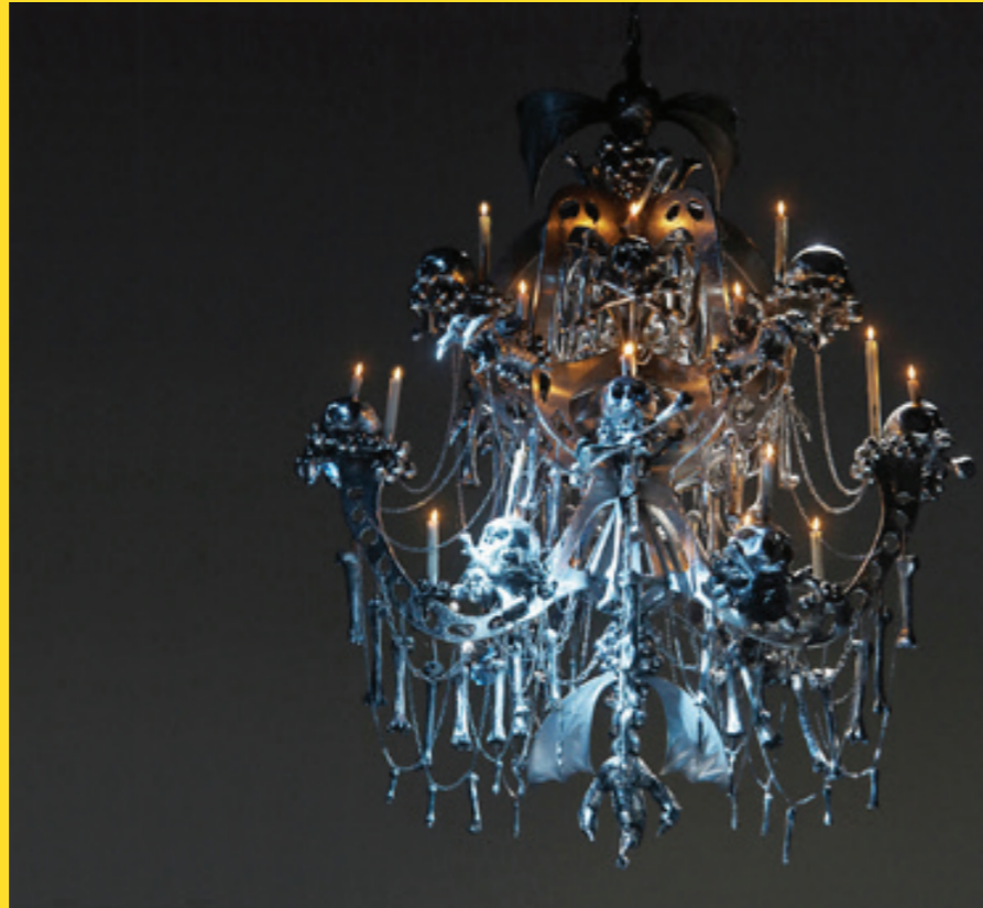
Don Carlo , Finnische Nationaloper Helsinki, Tschechische Staatsoper Prag, 2012 / © Walter Schütze