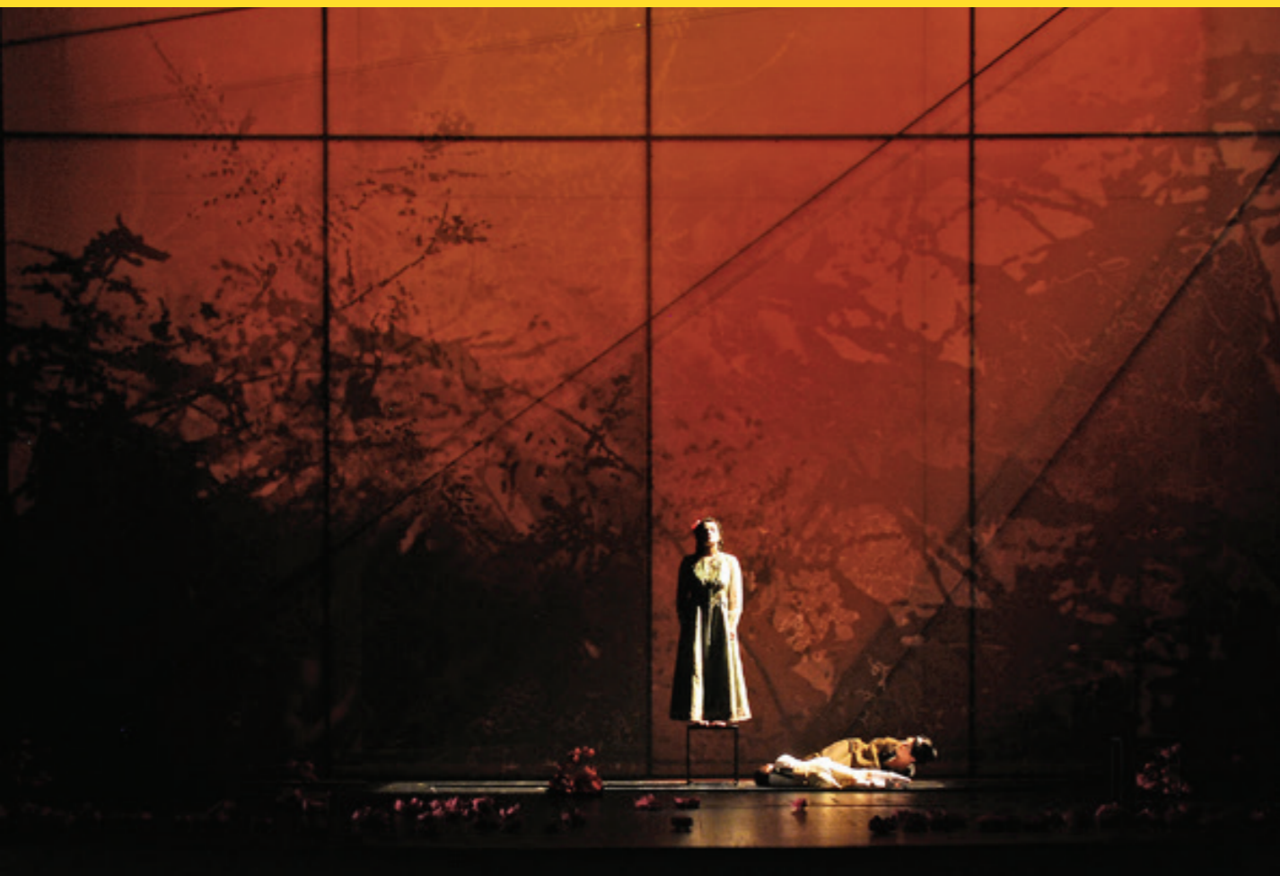
Madama Butterfly, Theater Kiel 2013

als vom Klimawandel bedroht sieht, ganz und gar nicht.