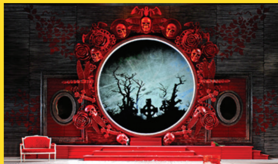
La Traviata, Staatstheater Cottbus, 2014