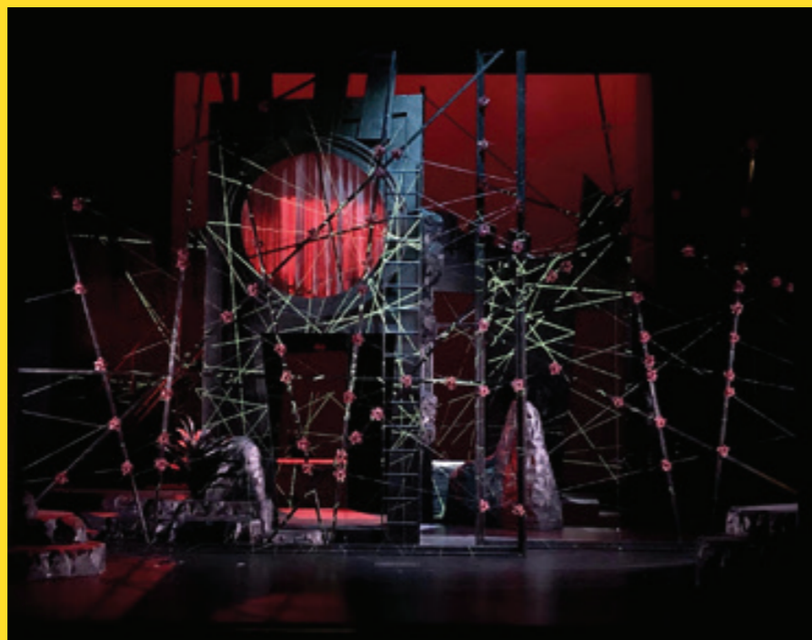
Dornröschen, Theater Neustrelitz, 2021

JK Wird die Ästhetik eines Theaterabends Deiner Meinung nach ausreichend in der Kritik berücksichtigt?