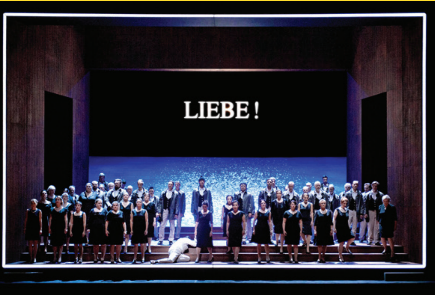
Der fliegende Holländer, Theater Bonn, 2015

„So, ich erzähle Dir jetzt mal, welche Summe ich für welche Produktion bekomme.“ Das hat mir damals wahnsinnig geholfen. Gerade als Anfänger*in hat man doch sonst überhaupt keine Ahnung, was man fordern kann und auch sollte. Welche Preise wir Theater-schaffenden haben, bestimmen doch nicht die Intendant*innen, sondern letztlich wir selbst.