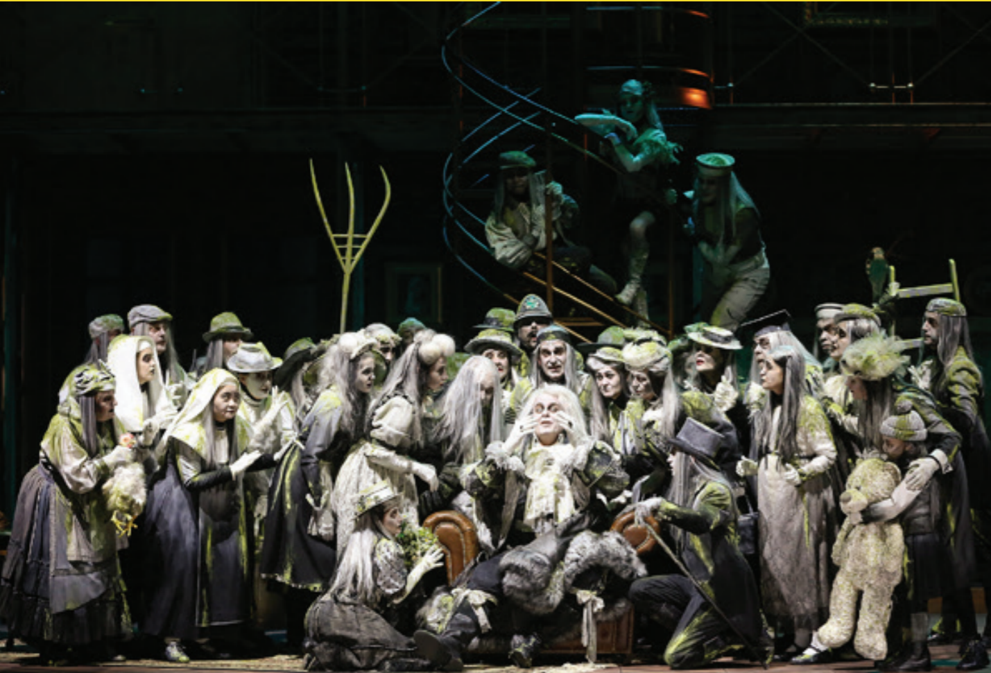
Das Gespenst von Canterville, Volksoper Wien, 2019