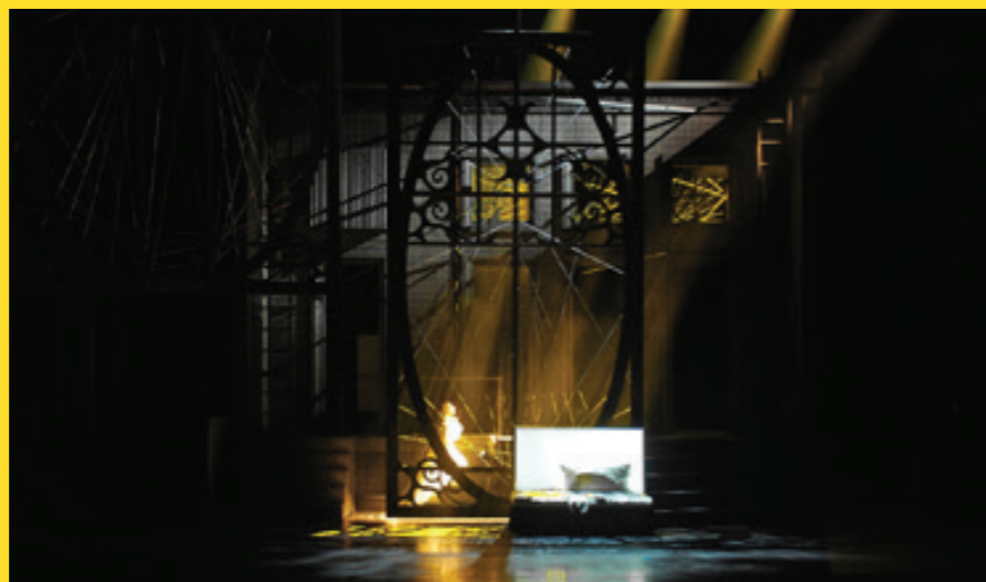
Otello, SNG Opera in Balet, Cankarjev Dom Ljubljana, 2016

wüssten, wie die perfekte Bühne für ihre oder seine Arbeit aussieht, dann könnten sie's ja auch gleich selber machen.