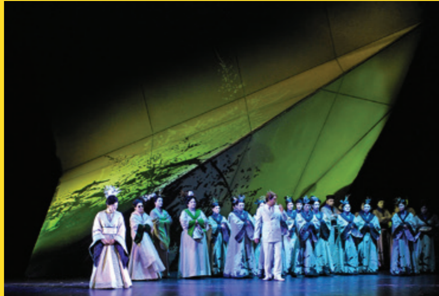
Madama Butterfly, Theater Kiel 2013