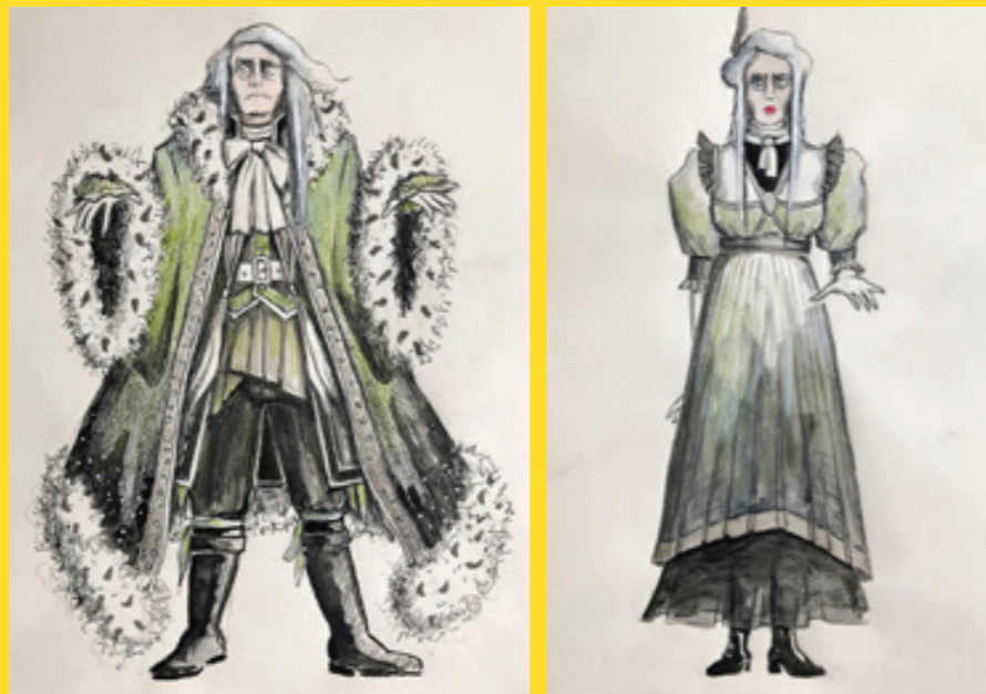
Das Gespenst von Canterville, Volksoper Wien, 2019

JK Wie gehst du in der Realisierung vor? Welche Methoden der Vermittlung nutzt du?