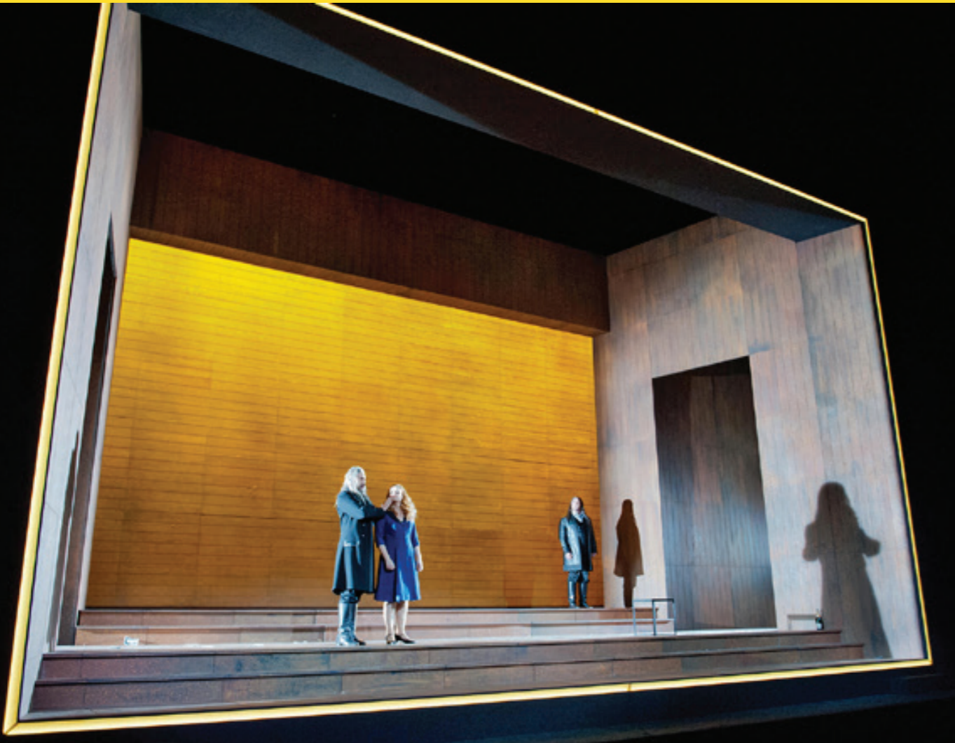
Der fliegende Holländer, Theater Bonn, 2015

mehr drin vorkommt. Was nicht heißen soll, dass er nicht vorkommen darf. Wir machen ja keine Kultur der Kultur willen. Oder doch? Ehrlich gesagt bin ich mir da manchmal nicht ganz sicher.